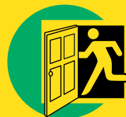
1 Ga direct naar binnen