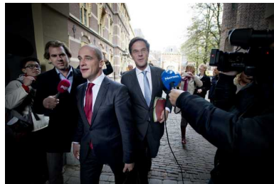
Samsom en Rutte kiezen bij de formatie voor radiostilte.