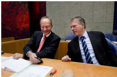
De informateurs Henk Kamp en Wouter Bos.