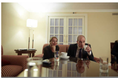
Diederik Samsom met zijn vrouw tijdens de verkiezingsavond.