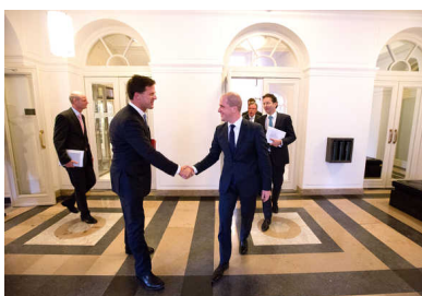
Rutte en Samsom feliciteren elkaar, hun fracties scharen zich achter het regeerakkoord.