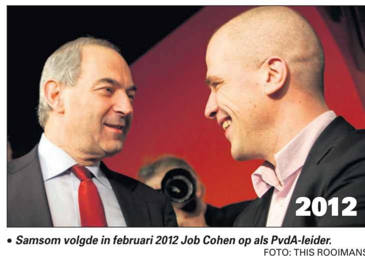
• Samsom volgde in februari 2012 Job Cohen op als PvdA-leider.