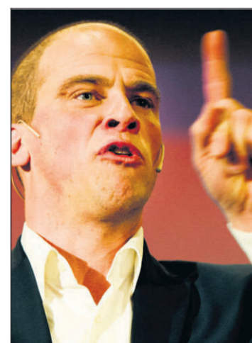
• Samsom lijkt op een verlies af te stevenen tijdens de verkiezingen voor het Europees Parlement.

De aanstaande Europese verkiezingen lijken uit te lopen op een afstrafing voor de PvdA. De sociaaldemocraten kregen vijf jaar geleden bij de stembusgang voor Europa al klop. Donderdag lijkt het opnieuw raak.