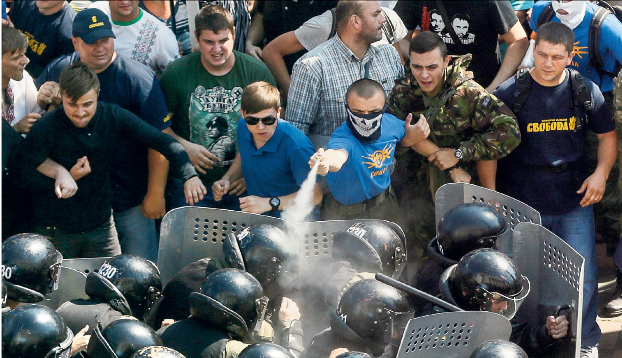
Begin september liep een demonstratie tegen decentralisatie van Oekraïne uit de hand, toen een rechts-nationalist een granaat naar de politie gooidde. Er vielen 3 doden en circa 140 gewonden.