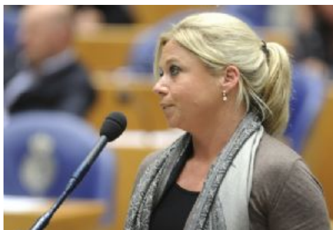
Jeanine Hennis-Plasschaert.

Geacht VVD-Tweede-Kamerlid Hennis-Plasschaert, beste Jeanine,