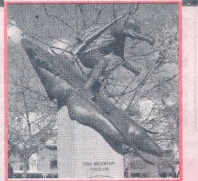
■ Een beeld van een skiënde militair van de 10e Bergdivisie dat Aspen als skioord op de kaart zette.

Hoewel het vooral bekend is als skioord, komen 's zomers toch de meeste toeristen om van de overrompelende natuur te genieten. Het lieflijke dorpie dat zo'n 6000 inwoners telt, groeit in het toeristenseizoen uit naar een plaats van 30.000 bewoners. Hotels zijn er in overvloed met het chique The Little Nell, als vlaggendrager. Het mooie van Aspen is de relaxte sfeer en de wonderschone omgeving. De straten zijn breed en hebben veel bomen. Vooral grote sparren, waarvan er één in de hoofdstraat met liefst honderdduizend lampjes is versierd, die elke avond een andere kleur licht geven.