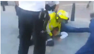
Beeld uit videofilm die bewoner maakte van politieoptredens.