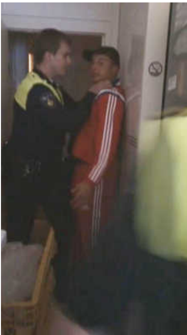
Beeld uit videofilm die bewoner maakte van politieoptredens.