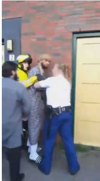
Beeld uit videofilm die bewoner maakte van politieoptredens.